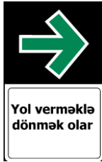
5.53. Daimi sağa dönmə

12. “Üfqi nişanlanma” qrupunun “v) digərləri” hissəsinə “1.25” nişanlanması əlavə edilsin.